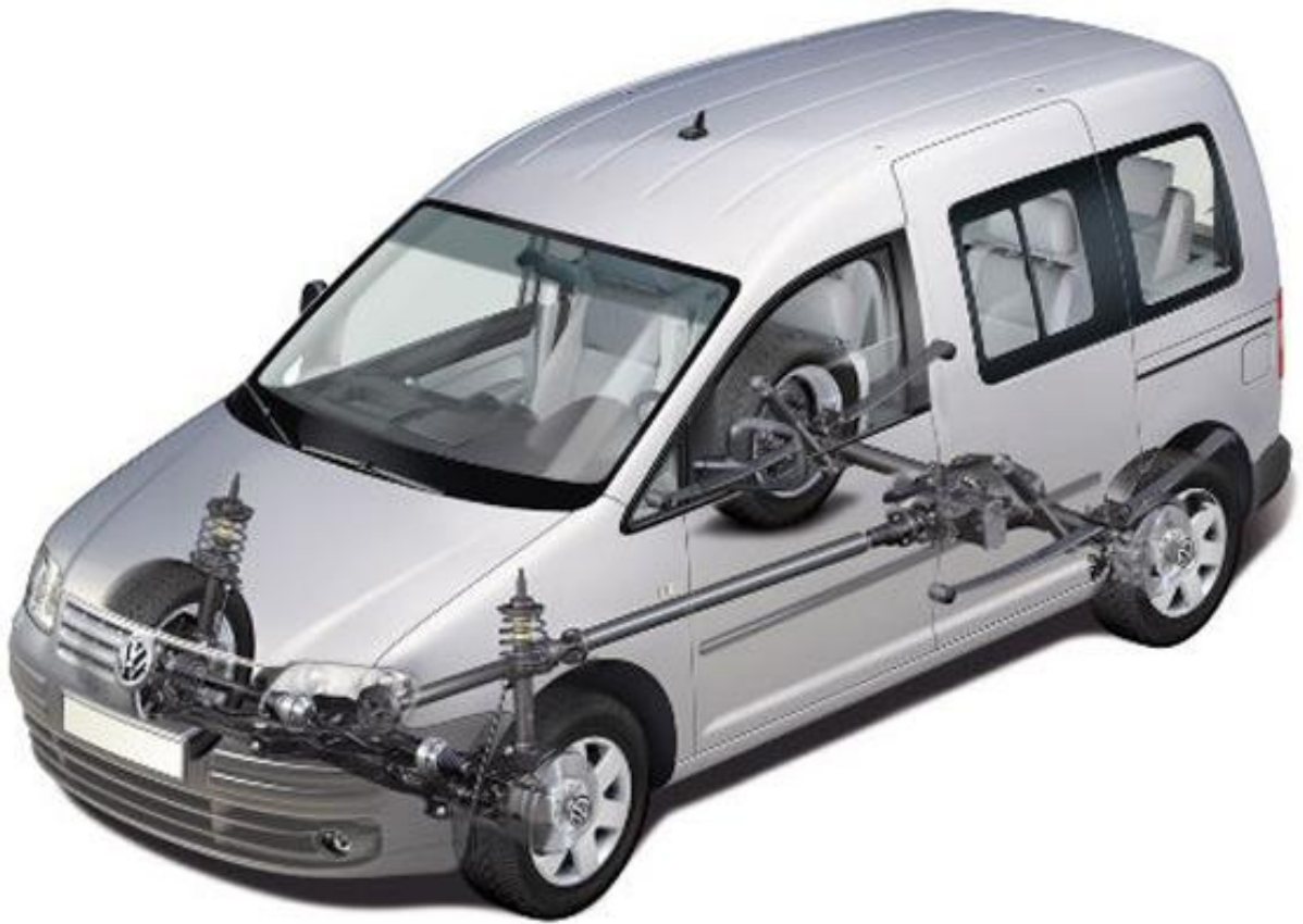
Volkswagen Caddy Dimensions.